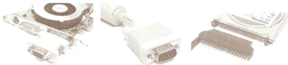
图 2 矩形连接器在计算机设备之间的连接应用

相对于圆形连接器来说矩形连接器空间利用率比较高,在电子设备中有着广泛的应用,图 2 所示为在计算机的主板与板卡之间的连接。