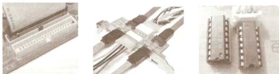
图 3 印制板连接器在计算机线路板中的应用