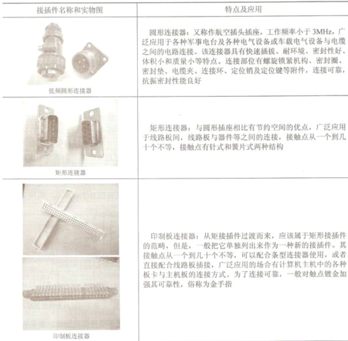
表 1 常见的连接器实物外形及特点应用